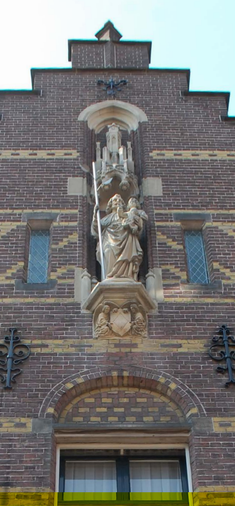
Dit beeld van Sint Jozef siert de gevel van het Sint Jozef ziekenhuis.

▶ U loopt nu terug richting Engestraat tot aan de Stromarkt, u gaat rechtsaf de Nieuwstraat in. U ziet aan uw linkerkant het Gildehotel ofwel het voormalige Sint Jozef ziekenhuis.