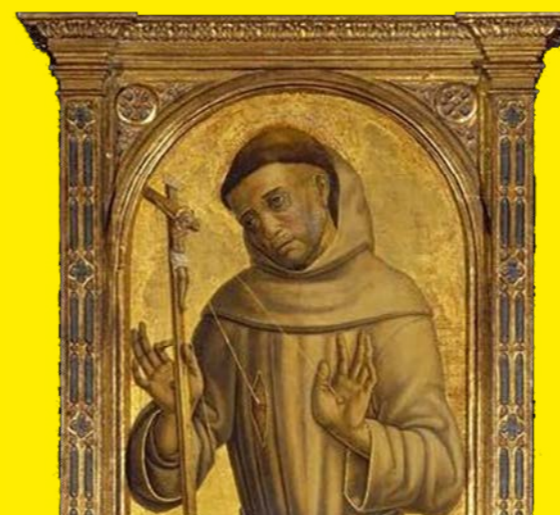
De heilige Franciscus [Schilderij door Vittorio Crivelli, na 1490: 'Saint Francis' Wikimedia Foundation, El Paso Museum of Art, VS]

De Bergkerk werd gesticht door monniken van het klooster Varlar in West-Munsterland en werd in 1206 gewijd. Het hoofdaltaar was gewijd aan Sint Nicolaas, maar ook Sint Maarten en verschillende andere heiligen hadden er een eigen altaar. Bij de reformatie gingen de altaren verloren maar de muurschilderingen in de kerk verdwenen onder een laag pleister. In 1915 werden in twee dichtgemetselde nissen muurschilderingen aangetroffen die waarschijnlijk kort na 1200 dateren en Sint Nicolaas en Sint Martinus afbeelden.